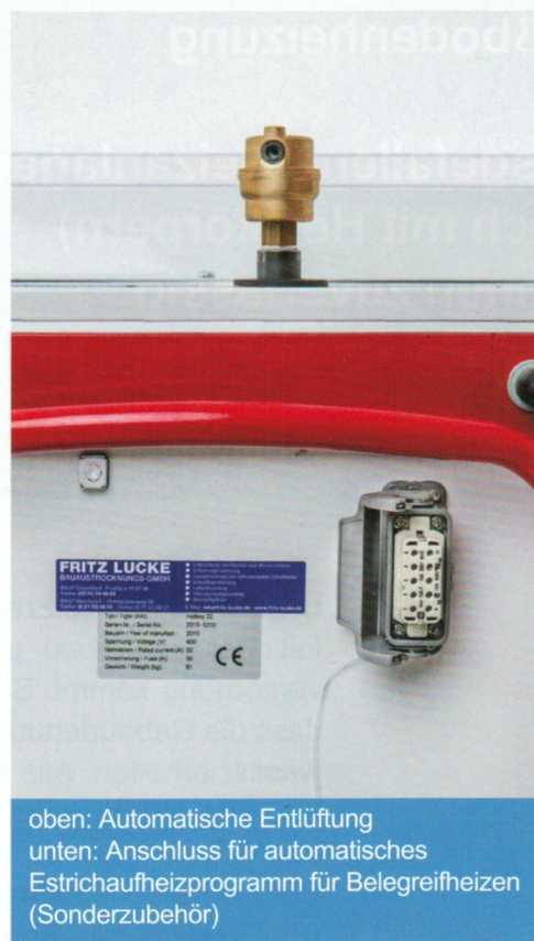
oben: Automatische Entlüftung unten: Anschluss für automatisches Estrichaufheizprogramm für Belegreifheizen (Sonderzubehör)